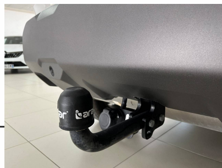
Dacia - Duster TCe 130 4x4 Extreme