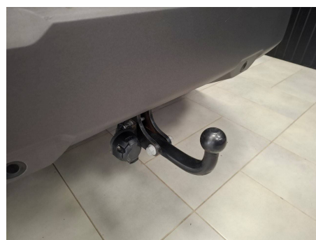
Dacia - Duster TCe 130 4x4 Extreme