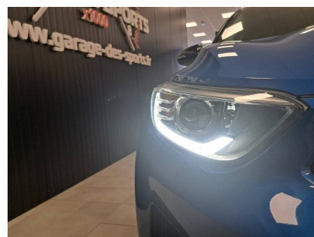
Kia - Stonic 1.0 T-GDi 100 ch DCT7 GT Line