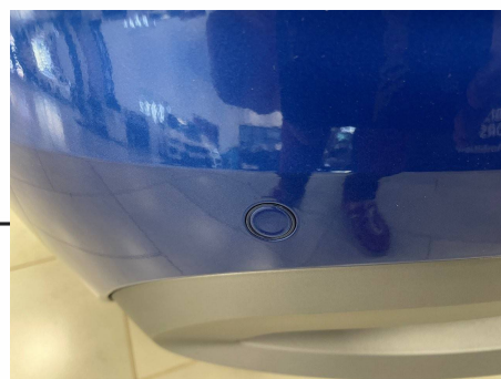
Skoda - Kamiq 1.0 TSI Evo 110 ch DSG7 Business