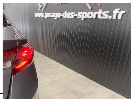
Skoda - Fabia 1.0 TSI 110 ch DSG7 Ambition pro 2 places