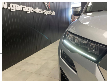
Skoda - Karoq 2.0 TDI 116 ch SCR DSG7 Business