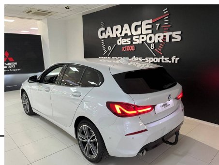
Bmw - 118i 136 ch DKG7 Edition Sport