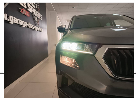
Skoda - Karoq 2.0 TDI 116 ch SCR DSG7 Business