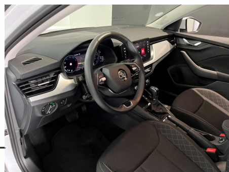
Skoda - Scala 1.0 TSI Evo 110 ch DSG7 Business