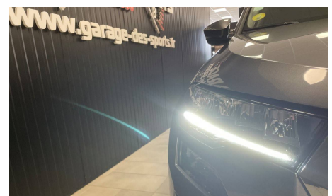
Skoda - Karoq 2.0 TDI 116 ch SCR DSG7 Business