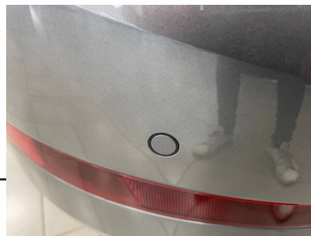
Skoda - Scala 1.0 TSI Evo 110 ch DSG7 Business