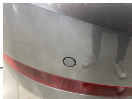
Skoda - Scala 1.0 TSI Evo 110 ch DSG7 Business