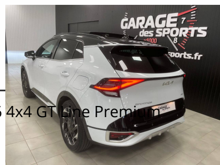
Kia - Sportage 1.6 T-GDi 265ch ISG Hybride Rechargeable BVA6 4x4 GT Line Premium