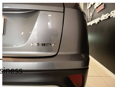
Mitsubishi - Eclipse Cross 2.4 MIVEC PHEV Twin Motor 4WD Business