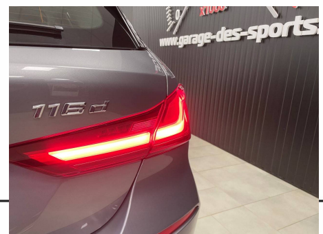
Bmw - 116d 116 ch DKG 7 Business Design