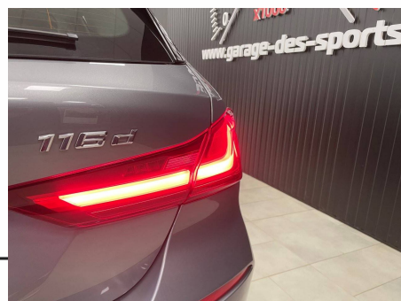
Bmw - 116d 116 ch DKG 7 Business Design