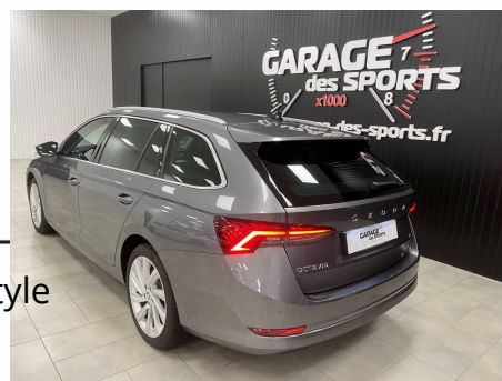
Skoda - Octavia Combi 1.5 TSI mHEV e-TEC 150 ch ACT DSG7 Style