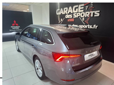
Skoda - Octavia Combi 1.0 TSI mHEV e-TEC 110 ch DSG7 Style