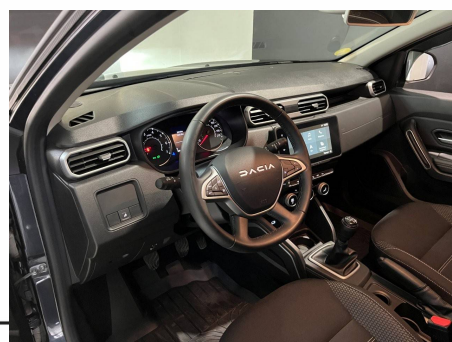
Dacia - Duster Blue dCi 115 4x2 Journey +