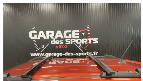
Dacia - Duster Mild Hybrid 130 4x4 Extreme