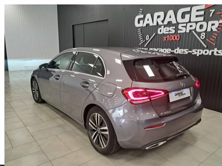
Mercedes - Classe A 180 d 8G-DCT Progressive Line