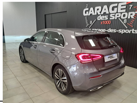
Mercedes - Classe A 180 d 8G-DCT Progressive Line