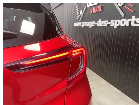
Renault - Captur TCe 100 GPL Evolution