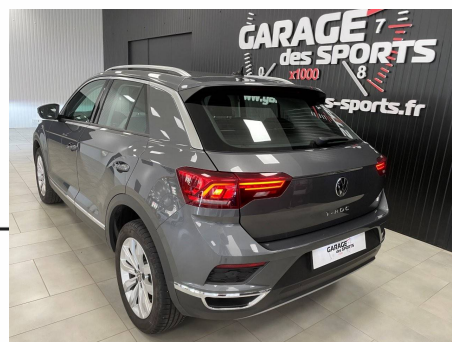
Volkswagen T-Roc 1.5 TSI 150 EVO Start/Stop DSG 7 Carat