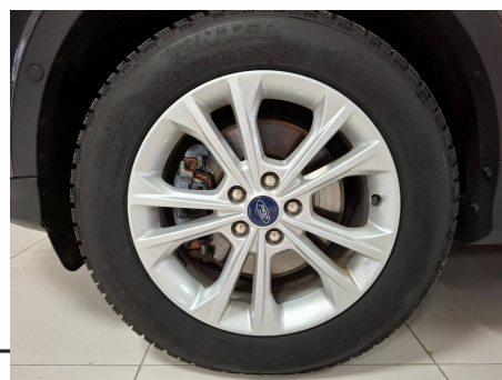
Ford - Kuga 2.0 TDCi 150 S&S 4x2 BVM6 Titanium