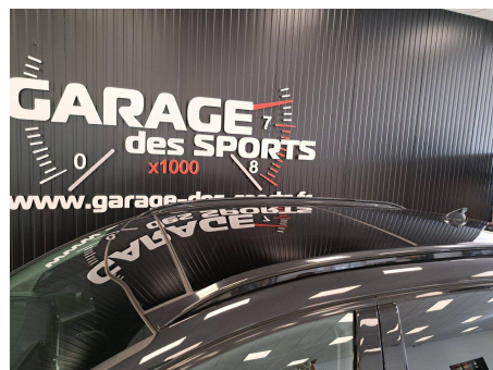
Kia - Sportage 1.6 T-GDi 230ch ISG Hybride BVA6 4x2 Design