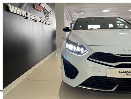
Kia - CEED 1.5 T-GDi 140 ch DCT7 GT-line