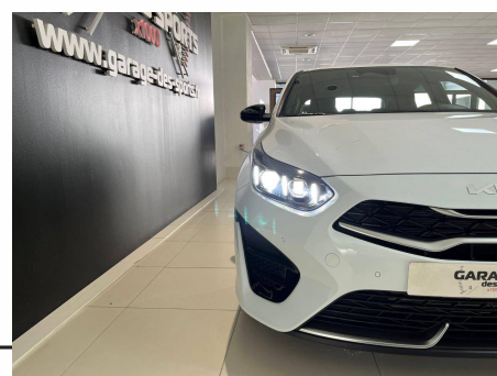
Kia - CEED 1.5 T-GDi 140 ch DCT7 GT-line