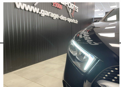
Mercedes - Classe A 200 4MATIC 8G-DCT AMG Line