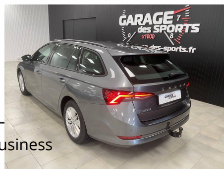
Skoda - Octavia Combi 1.5 TSI mHEV e-TEC 150 ch ACT DSG7 Business