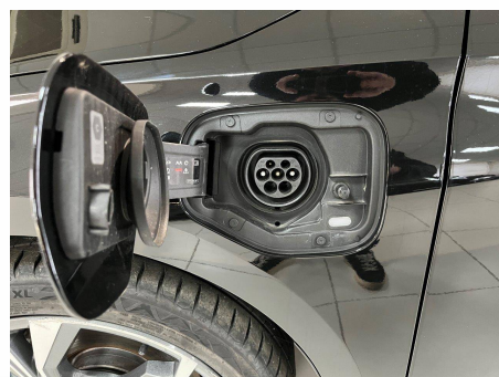
Audi - A3 Sportback 40 TFSIe 204 S tronic 6 Design Luxe