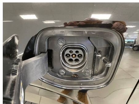
Kia - Niro 1.6 GDi 183 ch PHEV DCT6 Active