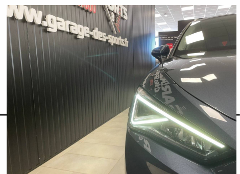
Seat - Leon Sportstourer 2.0 TDI 150 DSG7 Xcellence