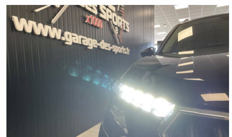
Skoda - Kamiq 1.0 TSI Evo 2 116 ch DSG7 Selection