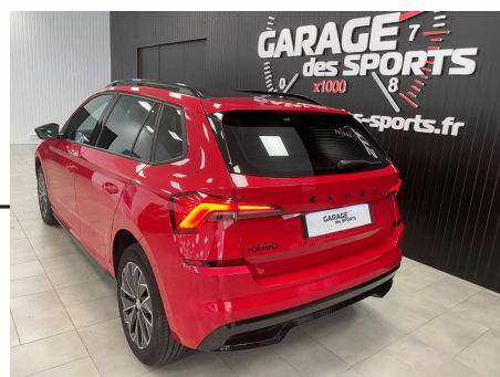
Skoda - Kamiq 1.0 TSI Evo 110 ch DSG7 Monte-Carlo