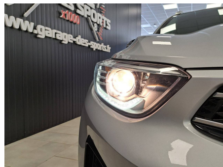
Kia - Stonic 1.0 T-GDi 100 ch BVM6 GT Line