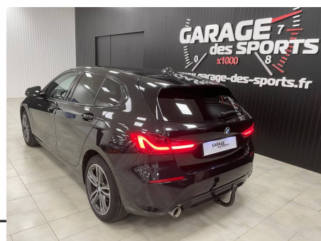
Bmw - 118i 136 ch DKG7 Edition Sport