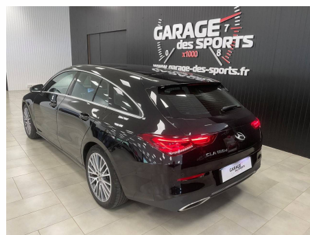
Mercedes - CLA Shooting Brake 180 d 8G-DCT Business Line