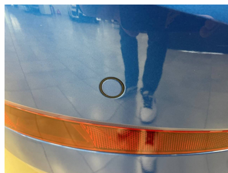
Skoda - Scala 1.0 TSI Evo 110 ch DSG7 Business