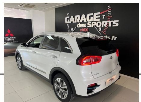
Kia - e-Niro - Électrique 204 ch e-Premium