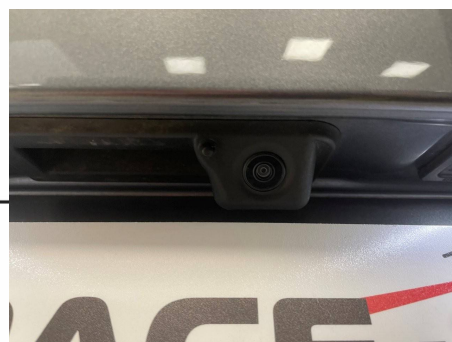
Skoda - Kamiq 1.0 TSI Evo 110 ch DSG7 Business