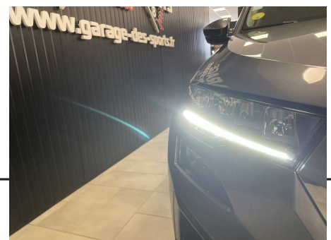
Skoda - Karoq 2.0 TDI 116 ch SCR DSG7 Business