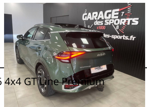
Kia - Sponage 1.6 T-GDi 265ch ISG Hybride Rechargeable BVA6 4x4 GT Line Premium