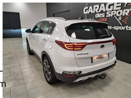
Kia - Sportage 1.6 CRDi 136ch MHEV DCT7 4x4 GT Line Premium