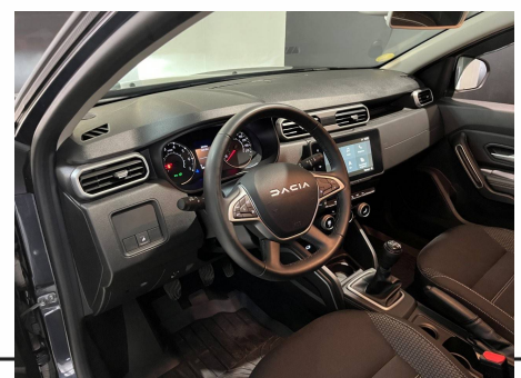
Dacia - Duster Blue dCi 115 4x2 Journey +