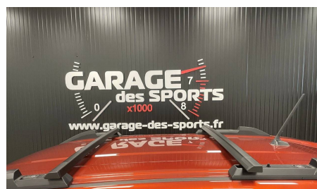
Dacia - Duster Mild Hybrid 130 4x4 Extreme