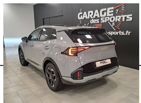
Kia - Sportage Hybride 239 ch BVA6 GT-Line Premium