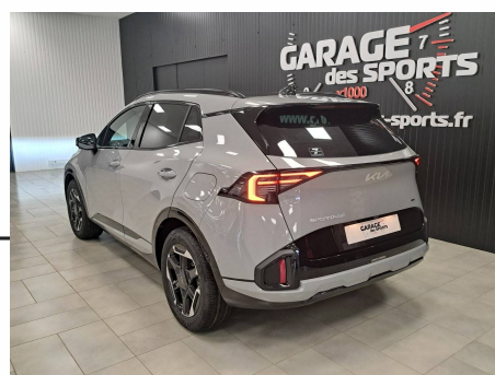
Kia - Sportage Hybride 239 ch BVA6 GT-Line Premium