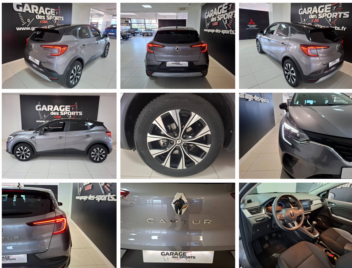
Renault - Captur TCe 100 GPL Evolution

ALAEVM DLIGM2 SGAR02 PRAHL CPE RDIF12 LVAVIP ESPHSA AIRBDE AIRBA2 ABLAVI AVOSP1 DWGE01 ABS AFURGE CSRGAC AEBS07 ECOMOD RETRJN SGAV01 ISOFIX