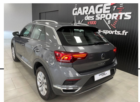
Volkswagen T-Roc 1.5 TSI 150 EVO Start/Stop DSG 7 Carat