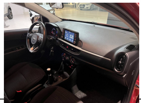
Kia - Picanto 1.0 essence MPi 67 ch ISG BVM5 Urban Edition