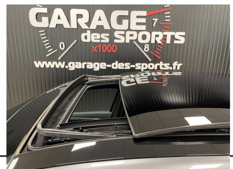
Renault - Arkana mild hybrid 160 EDC FAP - 22 R.S. Line