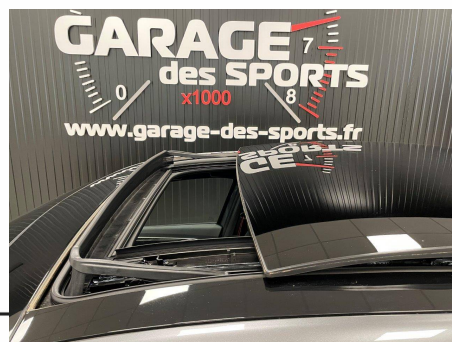
Renault - Arkana mild hybrid 160 EDC FAP - 22 R.S. Line