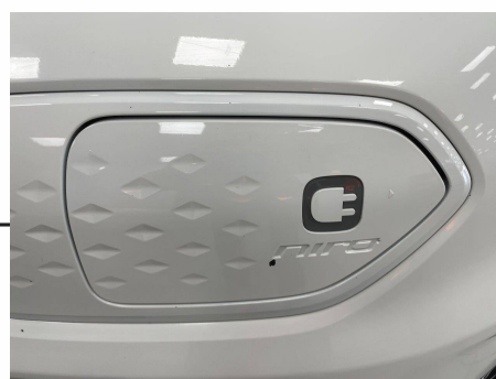
Kia - e-Niro Electrique 204 ch Active