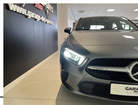
Mercedes - Classe A 180 d 8G-DCT Business Line